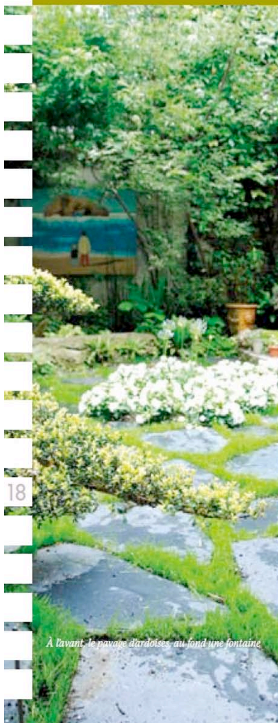
À l'avant, le pavage d'ardoises, au fond une fontaine.

Pour une néophyte, Delphine a fait preuve d'une grande sagesse dans ses choix en privilégiant les arbustes, quelques rosiers et des couvre-sols avec beaucoup d'espèces à feuillages persistants et décoratifs. Elle raconte qu'au printemps, ce sont les tulipes qui ouvrent le bal. « J'aime l'immense diversité de cette fleur, ses formes, ses