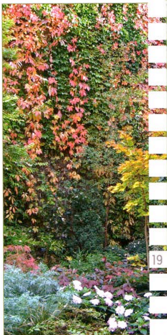
Le jardin des Bauches en automne

« J'aurais investi d'emblée dans un revêtement de terrasse plus qualitatif et j'aurais mieux mis en valeur la fontaine », avoue la maîtresse des lieux. Pour pouvoir continuer à faire vivre et évoluer ce lieu, le jardin des Bauches et les salles attenantes servent parfois d'écrin à des réunions prestigieuses, à des séances-photos, ou à des lancements de produits ■